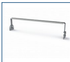
Кронштейн Лира Unit 180 (комплект)